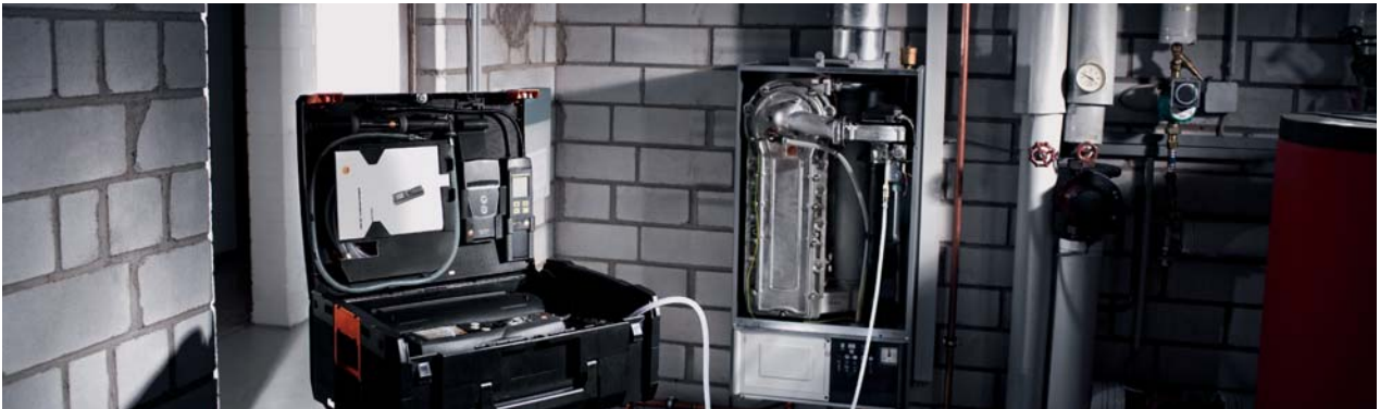
Controllo automatico della capacità operativa con serbatoio di riempimento gas collegato alla caldaia a gas