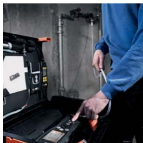
Controllo automatico della tenuta